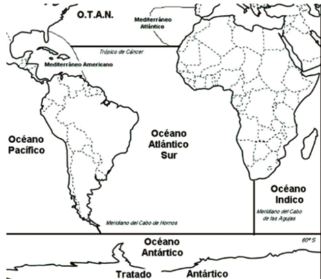
Mapa 1 Atlántico Sur extendido (Coutau-Begarie, 1988)

como enclave esencial en el panorama mundial actual y futuro. Su importancia se manifiesta en cuestiones económicas, políticas y militares.