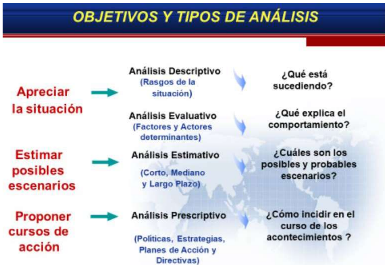
Fig.1. Objetivos y tipos de análisis. Elaboración del autor.

El análisis de las relaciones internacionales como proceso siempre está asociado a un objeto de análisis específico que se expresa en diferentes niveles (Morin, 2018): sistémico (sistema internacional);