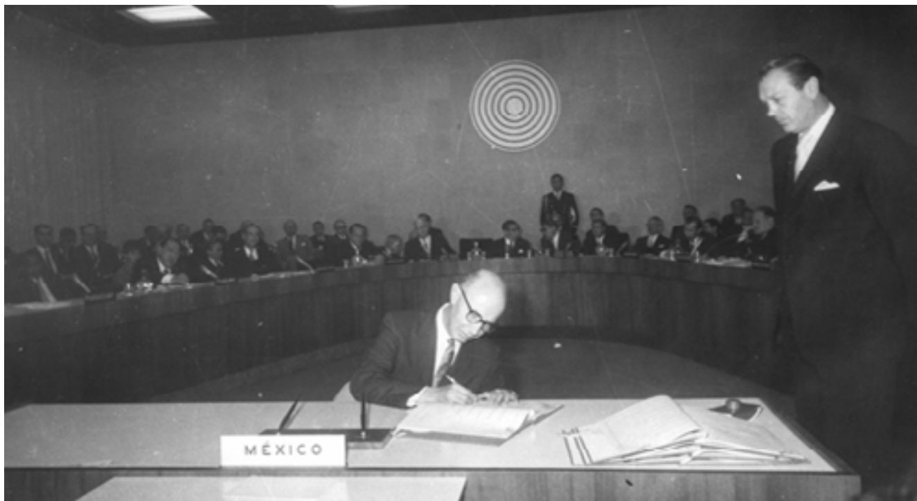
Fig. No. 3. Embajador Emérito Alfonso García Robles durante la firma del Tratado de Tlatelolco.

Como parte de las labores de la Comisión, se establecieron tres Grupos de Trabajo, que debían atender los siguientes tópicos: la definición de los límites geográficos de la ZLAN, la promoción de la colaboración regional, la incorporación de los Estados latinoamericanos que aún no eran parte de COPREDAL y la responsabilidad de otros Estados cuyos territorios pudiesen quedar comprometidos dentro de la zona (Grupo A); el estudio de los métodos de verificación, inspección y control para garantizar el cumplimiento de las obligaciones derivadas del futuro Tratado (Grupo B) 10 ; y la obtención del compromiso de respetar, estrictamente, el estatuto jurídico de la desnuclearización de la América Latina, por parte de las potencias nucleares (Grupo C) 11 .