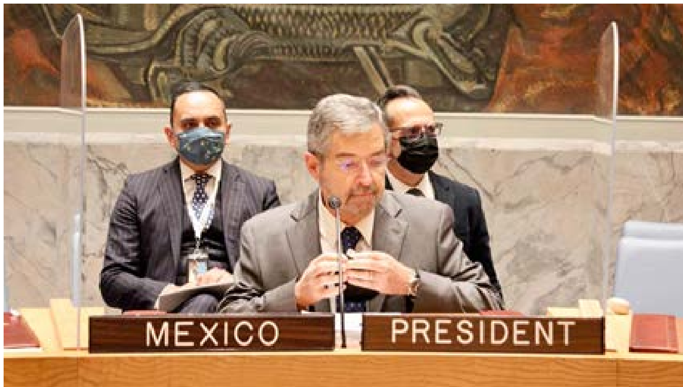
Fig. No. 1. Embajador mexicano ante el Consejo de Seguridad de las Naciones Unidas en 2021, Juan Ramón de la Fuente (ex-rector de la UNAM).