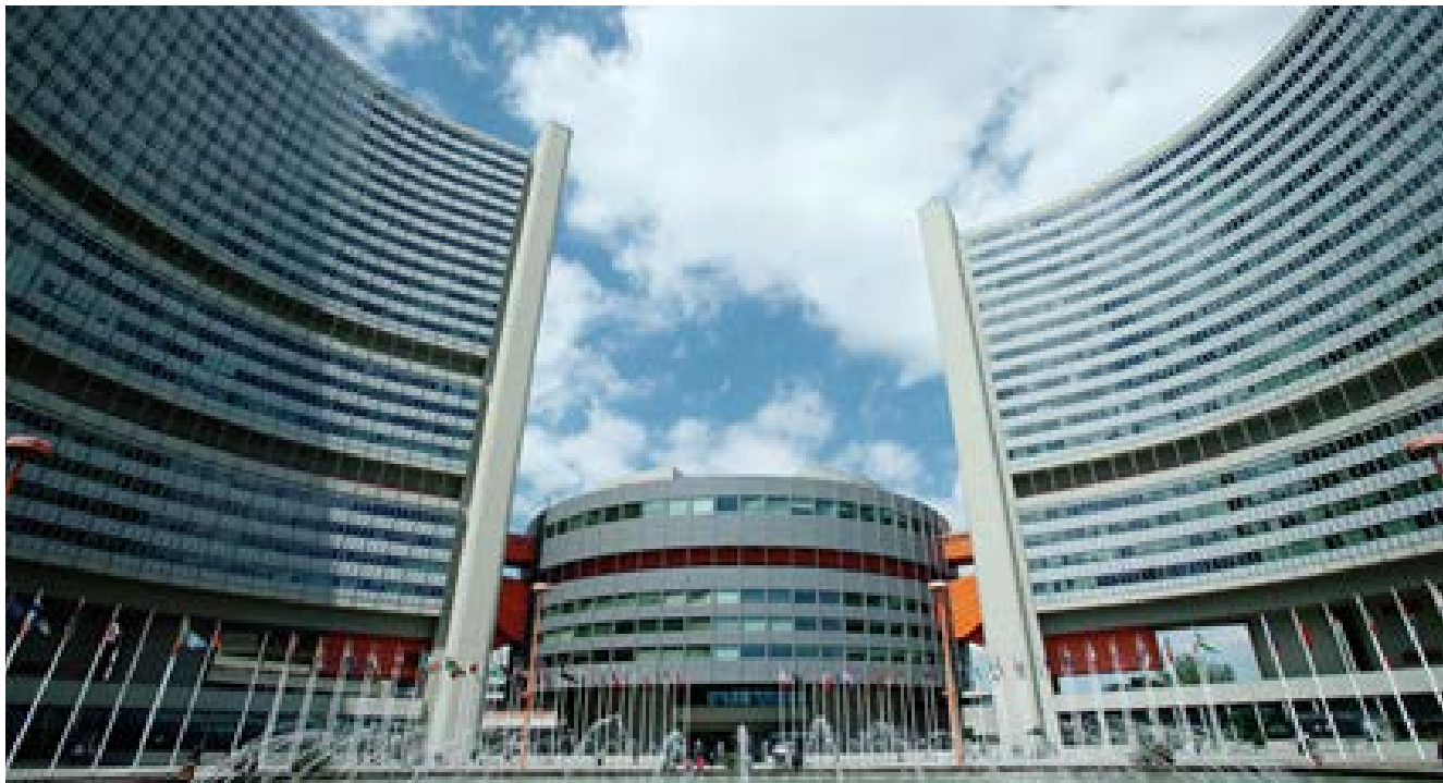
Fig. No. 2. Sede del Organismo Internacional de Energía Atómica (OIEA) en Viena, Austria.