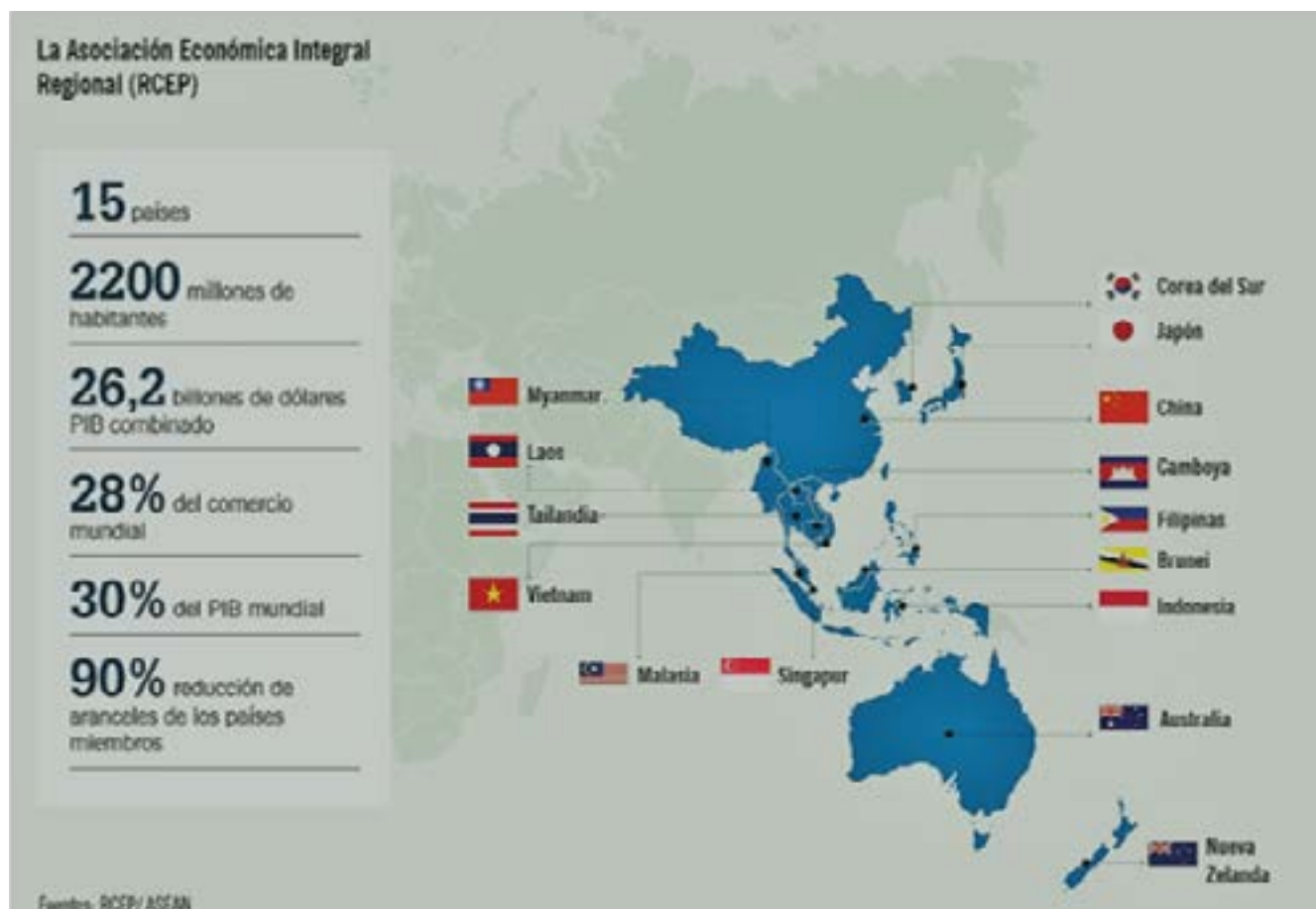
Fig. 1. Datos claves y países miembros del RCEP

nización regulatoria en la región ante la proliferación y solapamiento de acuerdos comerciales de diverso tipo. Muchos países, incluyendo de la región de Asia-Pacífico (AP), mostraron creciente interés en avanzar los llamados temas "OMC Plus", en lugar de priorizar acuerdos de comercio tradicionales.