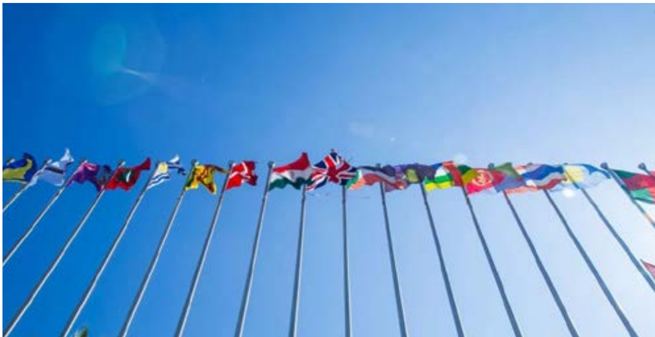
Fig. 1: La Convención de Viena sobre Relaciones Consulares aborda aspectos referentes al establecimiento, funciones y privilegios de las oficinas consulares y las facilidades e inmunidades de estas y de sus funcionarios.

Es importante señalar que lo anterior no significa que establecerán la defensa personal de los individuos acusados ante los tribunales de justicia, pues el derecho a administrar justicia en el territorio de un Estado es un ejercicio de soberanía que solo puede ser ejercido por el Estado mismo (principio básico del Derecho Internacional Público).