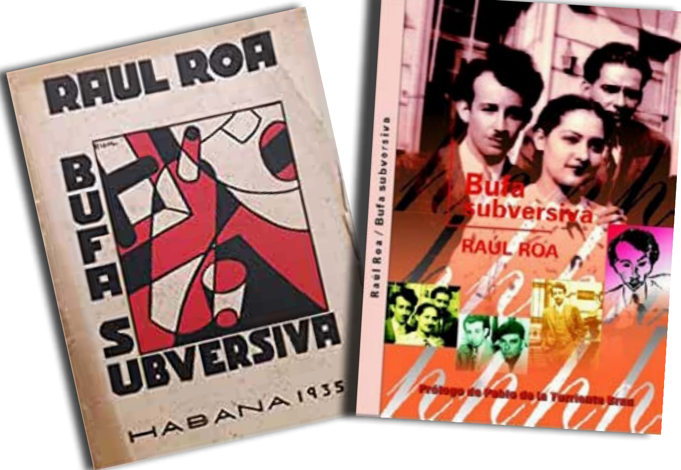
■ Fig. 1. Bufa Subversiva , su primer libro, de 1935.

Al ser liberado, se incorporó al Comité Ejecutivo del Ala Izquierda Estudiantil, desde donde combatió la “mediación” de Sumner Welles 2 y participó en la organización y desarrollo de la huelga general que dio al traste con la dictadura. Fue el primer estudiante que entró en la