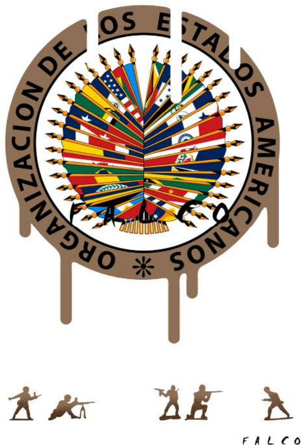
Fig.1. La desprestigiada Organización de Estados Americanos (OEA).

sión de guerra de Corea, que promovió una mayor integración de América Latina a la política guerrillista de Washington. Las resoluciones de la Cuarta Reunión de Consulta, auspiciada por Estados Unidos con el pretexto de la agresión comunista a Corea del Sur, fortalecieron la orientación reaccionaria del sistema regional y el dominio norteamericano sobre el mismo, al propio tiempo que revelaron el verdadero alcance del Tratado Interamericano de Asistencia Recíproca (TIAR), al extenderse el principio de solidaridad continental a un conflicto que se desarrollaba fuera del hemisferio.