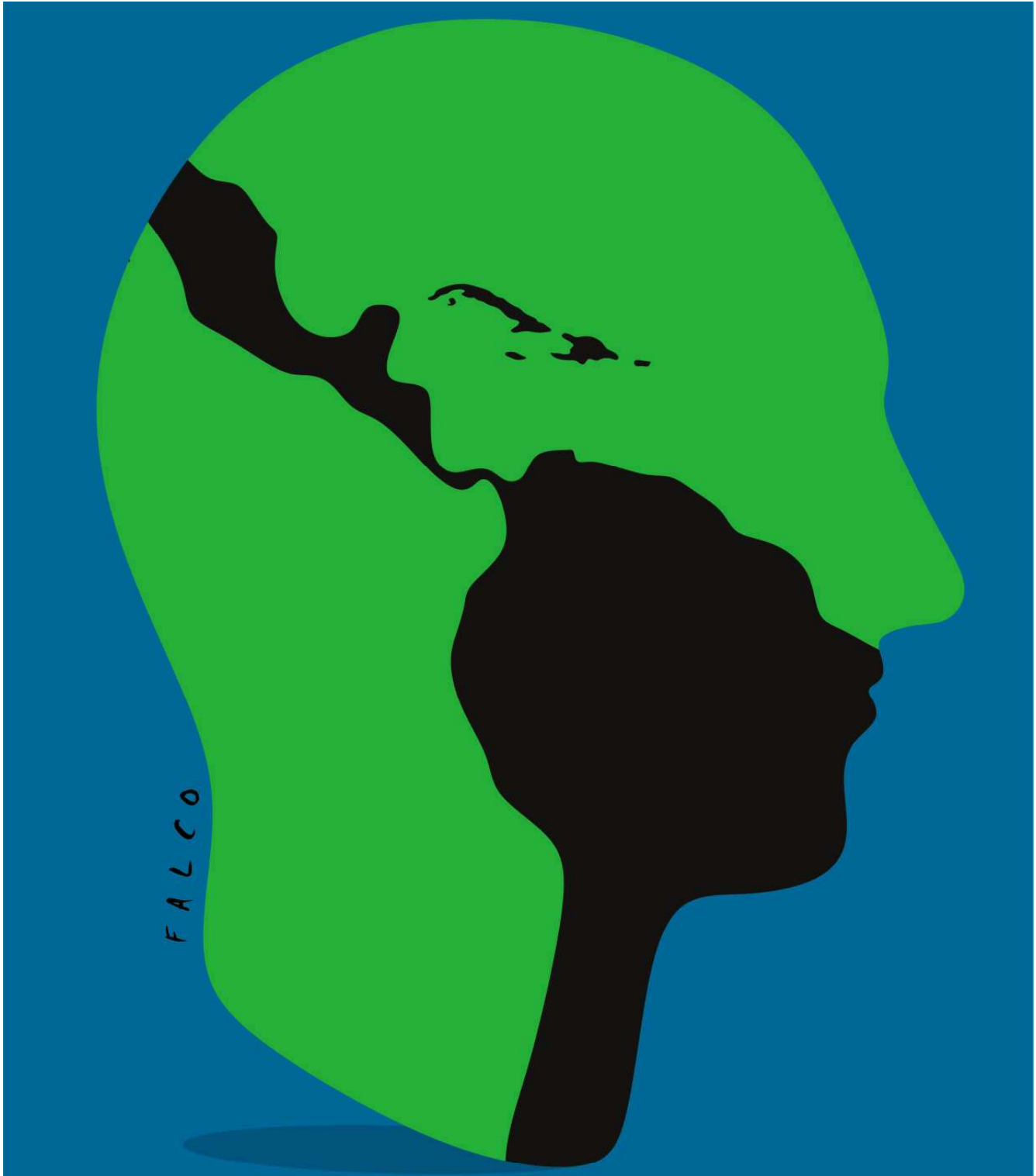
Fig. 1. América Latina y el Caribe

a su favor, así como la aplicación de herramientas jurídicas contra dirigentes políticos y sociales progresistas como parte de la estrategia de judicialización de la política y la criminalización de la protesta social.