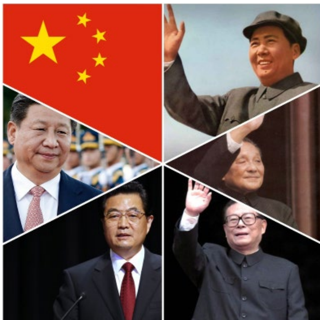
Fig.2. Pensamiento socialista con características chinas. (Manosfuera de China, 2017)

Resulta particularmente importante conocer al respecto la apreciación de Li Cheng, director del Centro de Estudios Chinos John L. Thornton, del Instituto Brookings, sobre las “cuatro integralidades” que caracterizan el proceso de construcción socialista en su actual etapa, las que surgen justo en el momento en que China presta una mayor atención a la mejora de la gobernanza tras consumir el “milagro económico” y la justicia social se convierte en meta importante y el “Estado de derecho” adquiere relevancia. Para Li, la “sociedad modestamente aco-