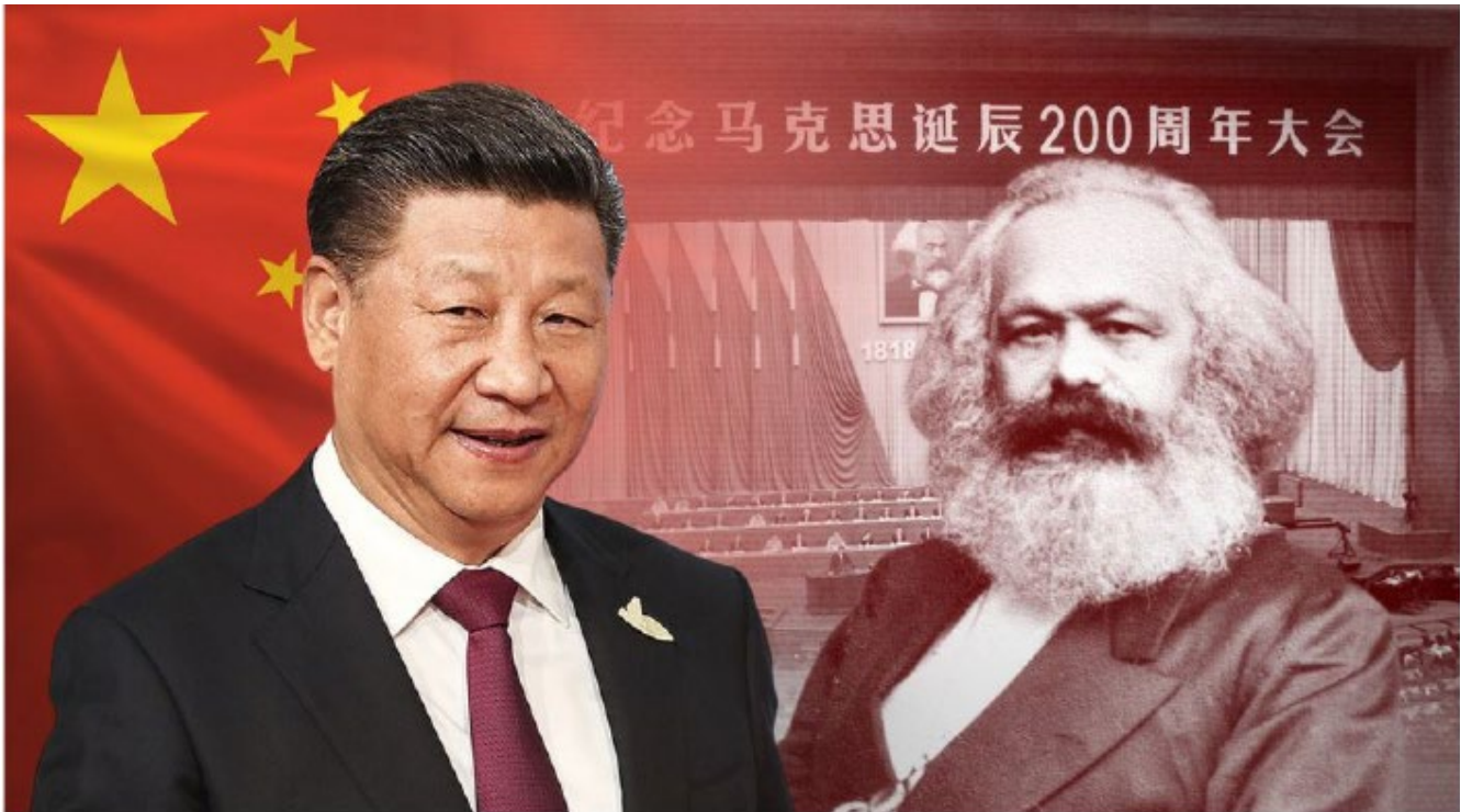
Fig.1. Xi Jinping ha enfatizado en importantes discursos la necesidad de desarrollar el marxismo chino contemporáneo.

primera vez en 1938, cuando en ocasión de reeditarse las “Obras Escogidas de Mao Zedong”, este cambió la frase original de “concreción del marxismo en China” por dicha formulación.