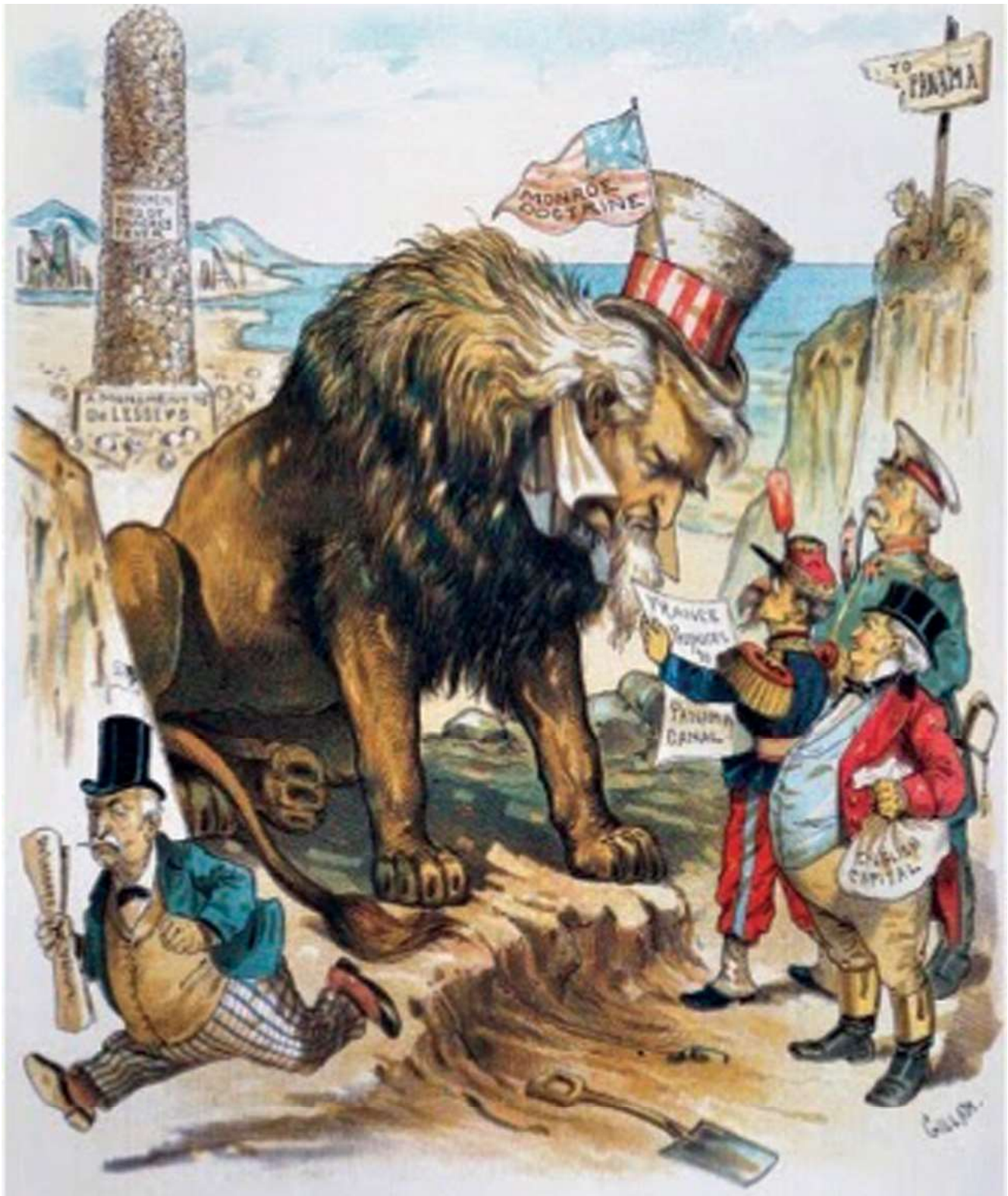
Fig. 2. Representa Doctrina Monroe y Destino Manifiesto -PressReader

der, dominación, hegemonía), cuya identificación teórica es muy variada y motivo de polémica entre las diferentes posiciones intelectuales y políticas de los autores y corrientes que las abordan en las ciencias sociales.