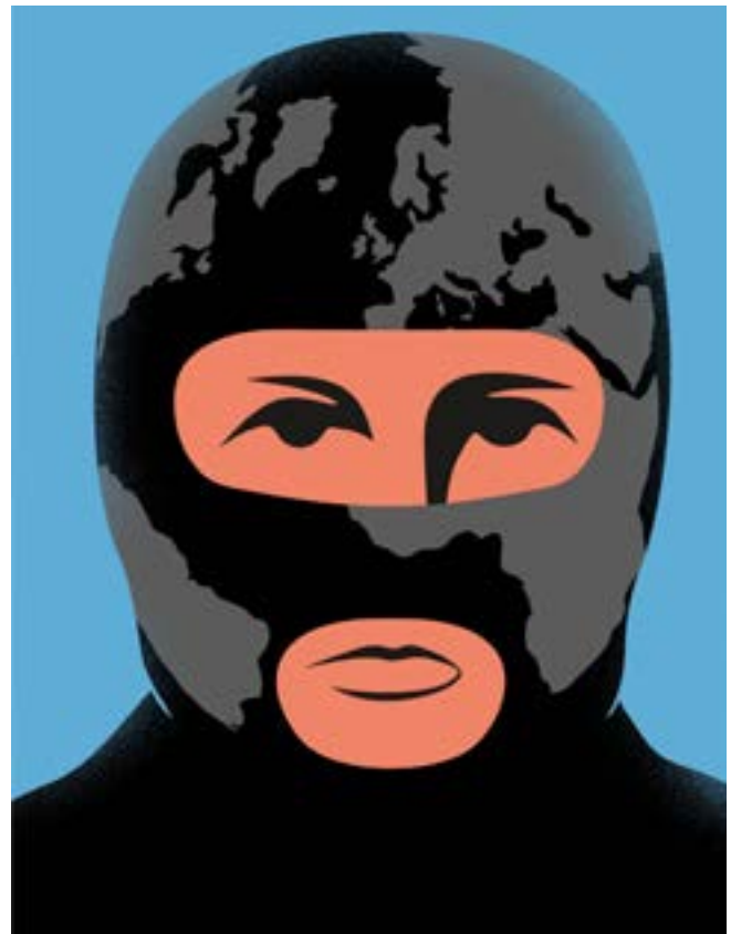
■ Fig.1. El fracaso de las guerras “antiterroristas” han estado en el centro de la transformación multipolar del sistema internacional.

En estas condiciones, el gobierno ruso ha hecho un gran esfuerzo por convertir la Organización del Tratado de Seguridad Colectiva (OTSC) en una alianza político-militar, pero ha debido enfrentar la desconfianza mutua de la mayoría de sus miembros e incluso entre ellos mismos, además de las diferencias existentes en sus agendas de seguridad. La incapacidad de sus miembros de identificar, determinar las amenazas internas y separarlas de las externas y de acordar los métodos de contrarrestarlas, es un problema que no ha podido solucionar la OTSC. Si bien la Unión Europea se ha mantenido subordinada a la gran estrategia de Estados Unidos, Rusia ha buscado contrapeso del lado asiático, incrementando su cooperación con las antiguas repúblicas soviéticas,