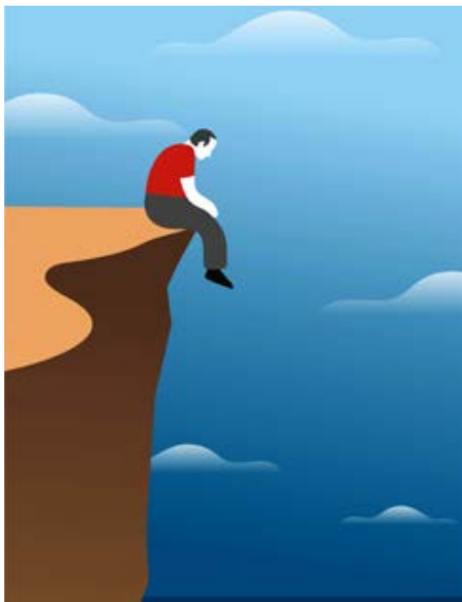
Fig. 1. La marginalidad como fenómeno que se renueva en el espacio y el tiempo.

J. Nun, apoyado en el concepto de ejército industrial de reserva, expuesto por Carlos Marx en varios de sus textos para designar los efectos funcionales de la superpoblación relativa en la fase del capitalismo que él estudió, introduce el concepto de masa marginal