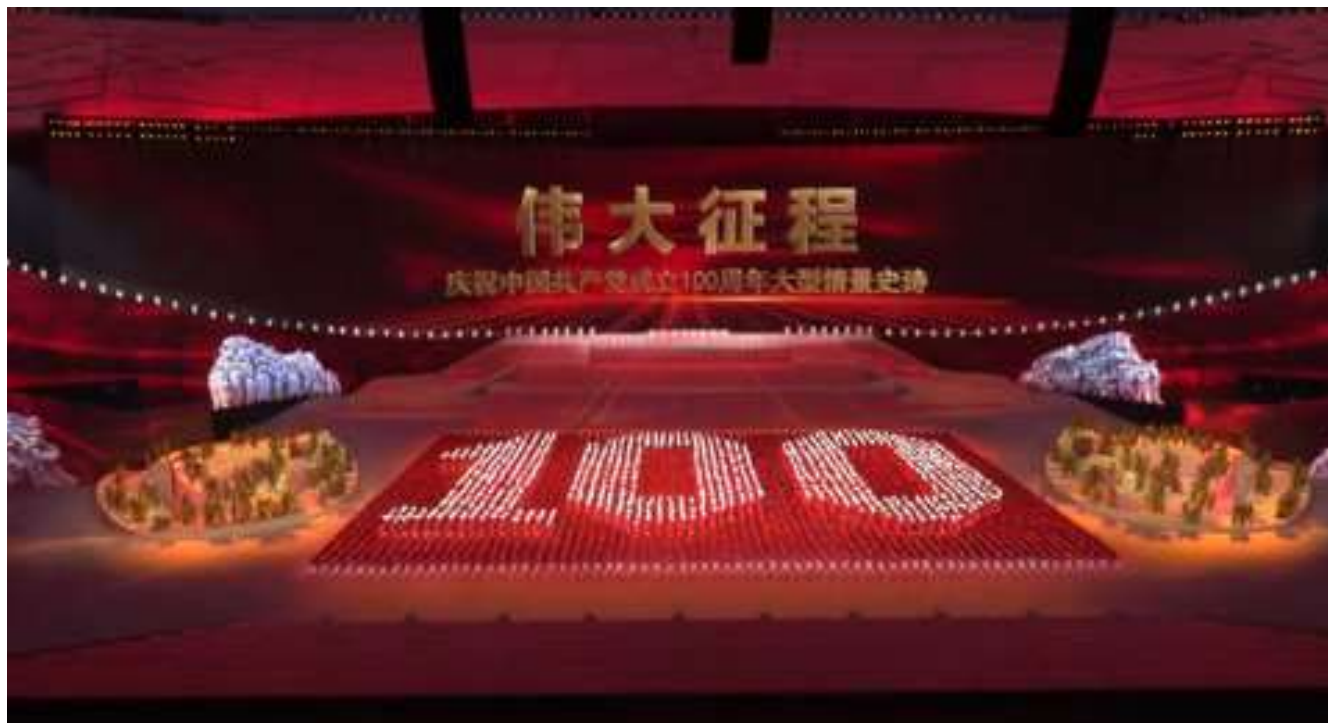
Fig. 1. Centenario del Partido Comunista de la República Popular China.