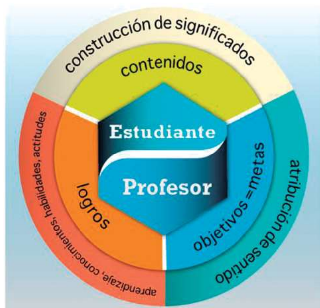
Fig.2. Programa Integración de Tecnologías a la Docencia.

Enfoque transdisciplinar en los Estudios Migratorios (EM) en la Universidad de La Habana: puntos articuladores con la cultura y las relaciones internacionales