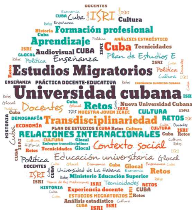
Fig.1. Mapa de palabras confeccionado por las autoras.

Las ideas anteriores se concretan en las premisas fundamentales que han regido el Plan de Estudios E de la enseñanza superior. Entre ellas, el continuo incremento de la calidad en el proceso de formación y el concepto de formación integral. Esta última forma parte de las bases conceptuales para el diseño de estos planes, proponiéndose lograr una efectiva flexibilidad curricular, término que remite a la existencia de tres tipos de contenidos: base, propio y optativo/electivo. Estos últimos actúan como complemento para la formación integral del estudiante y responden a sus intereses de desarrollo personal.