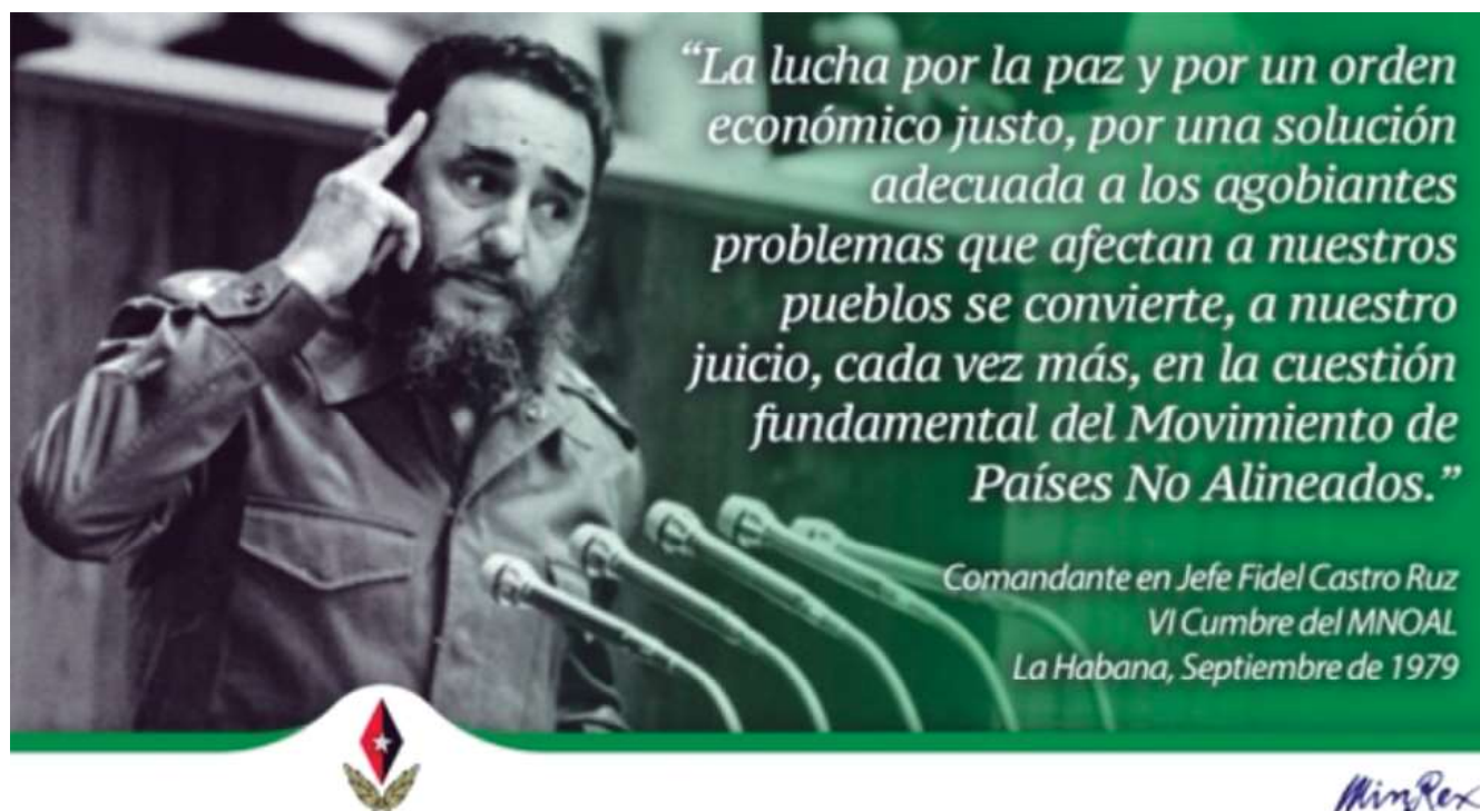
Fig. 3. Fragmento discurso de Fidel Castro VI Cumbre, La Habana, 1979.

Hacia 1979 los cubanos podían sentirse más que satisfechos con su política exterior en el seno del Movimiento de Países No Alineados, pues conseguida la presidencia del foro adquirieron un poder de influencia inédito. Habían logrado congeniar sus identidades múltiples, es más, sus calidades de país no alineado, socialista, subdesarrollado y latinoamericano se complementaron y potenciaron en su interrelación. Todas las dimensiones de la política exterior de Cuba se habían aglutinado en torno a posiciones de principios sobresaliendo su antimperialismo en tanto común denominador que interpelaba con similar fuerza persuasiva a sus pares socialistas, no alineados y latinoamericanos (Alburquerque, 2007).