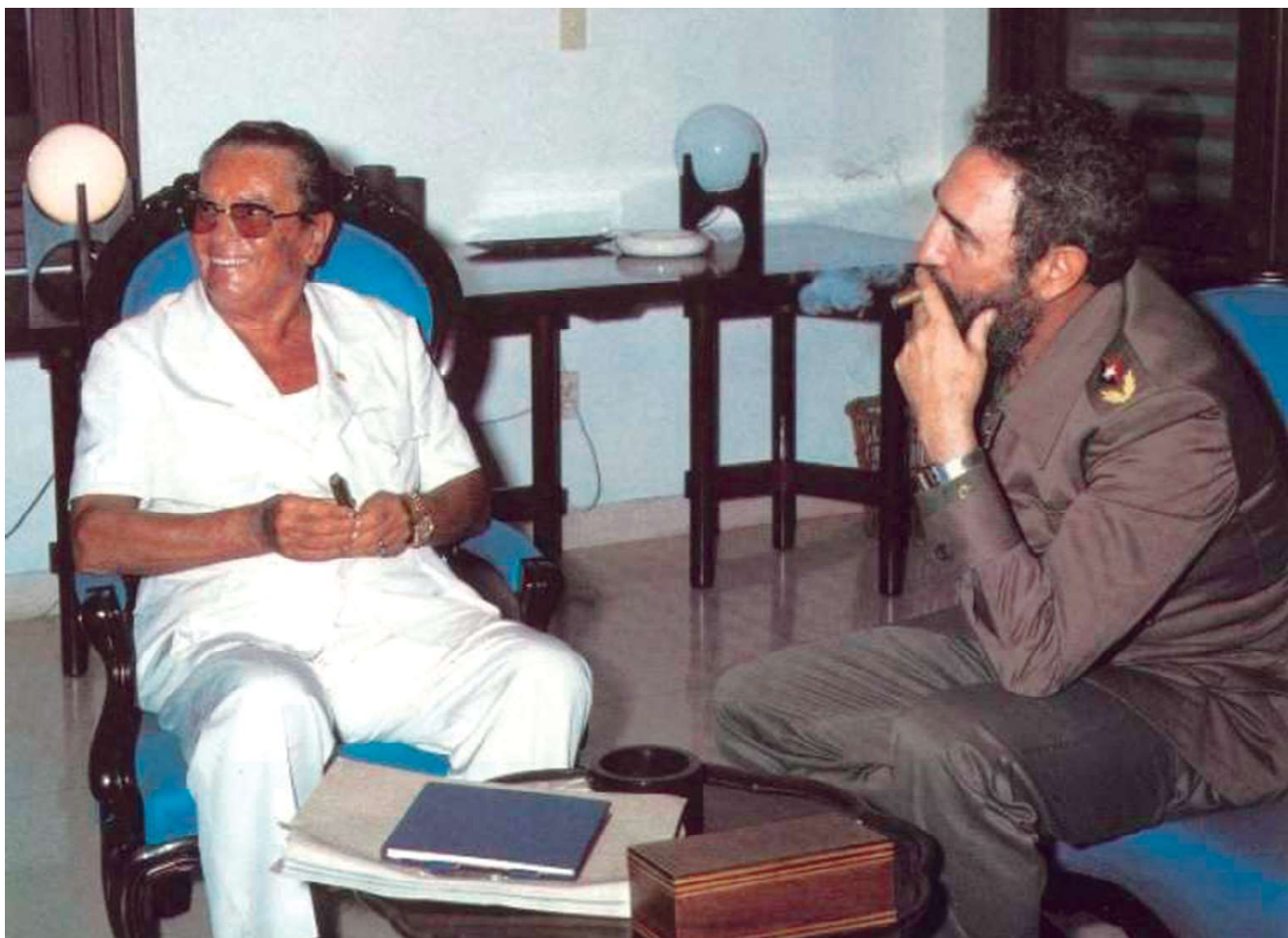
Fig. 2. Encuentro entre Fidel y Tito.

Estas nuevas dimensiones se consolidarían seis años más tarde en la Sexta Cumbre en La Habana, con el documento más completo e integral concebido por el Movimiento en materia de solidaridad, antimperialismo, cohesión y unidad de todas las fuerzas políticas progresistas del mundo por el cumplimiento de los principios del Derecho Internacional, y con el llamado a las negociaciones globales sobre Desarrollo y Cooperación Económica Internacional.