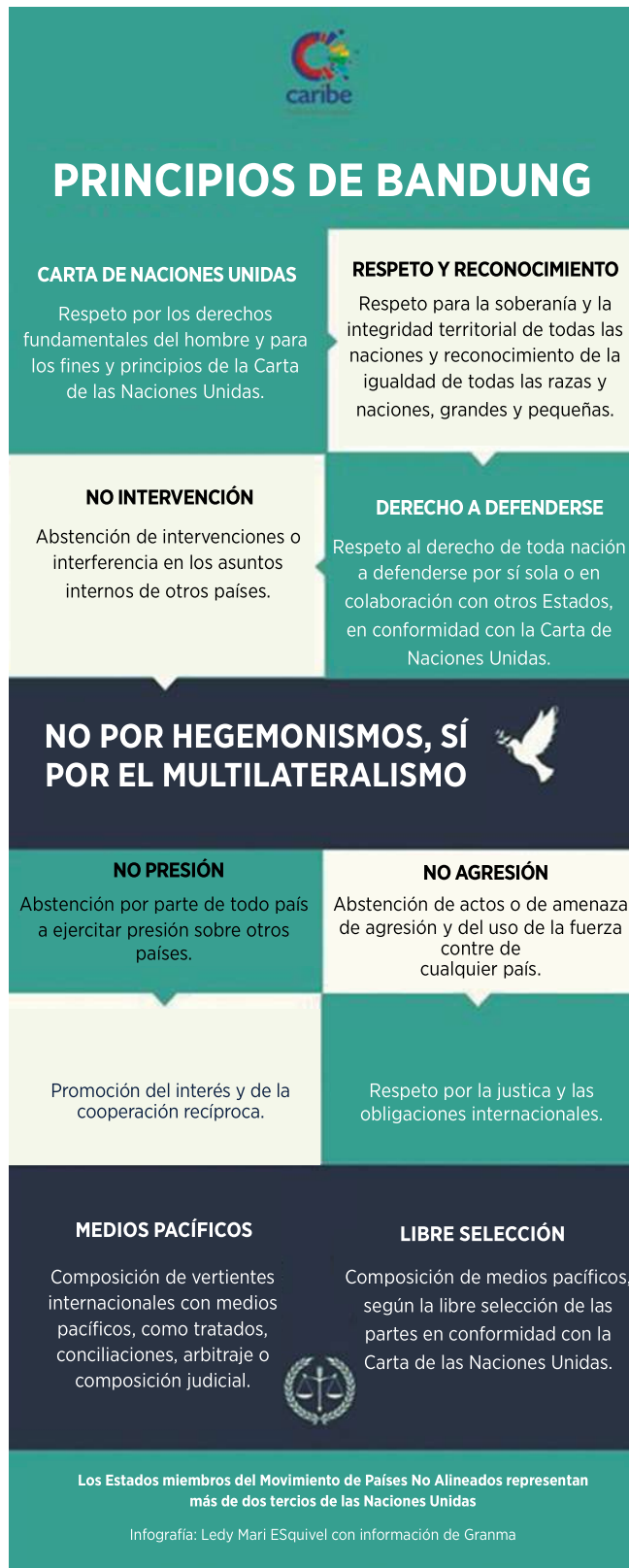
Fig. 1. Diez Principios de Bandung.

Bajo el liderazgo de los presidentes de Yugoslavia, Josep Broz Tito; de la República Árabe Unida, Gamal Abdel Nasser y de Indonesia, Ahmed Sukarno, a los cuales se asociaron los líderes de la India, Jawaharlal Nehru y de Afganistán, Mohammed Daud Khan, el Movimiento de Países No Alineados tuvo su presentación formal en la Primera Conferencia del MNOAL celebrada en Belgrado, Yugoslavia, del 1ro. al 6 de septiembre de 1961. Cuba tiene el mérito político-diplomático e histórico de haber sido el único país de América Latina y el Caribe que participó en la fundación del movimiento, cuando se agudizaba su conflicto histórico con Estados Unidos, por sus agresiones económicas y amenazas militares, y la Revolución Cubana reafirmaba con profundas transformaciones económicas y sociales su carácter