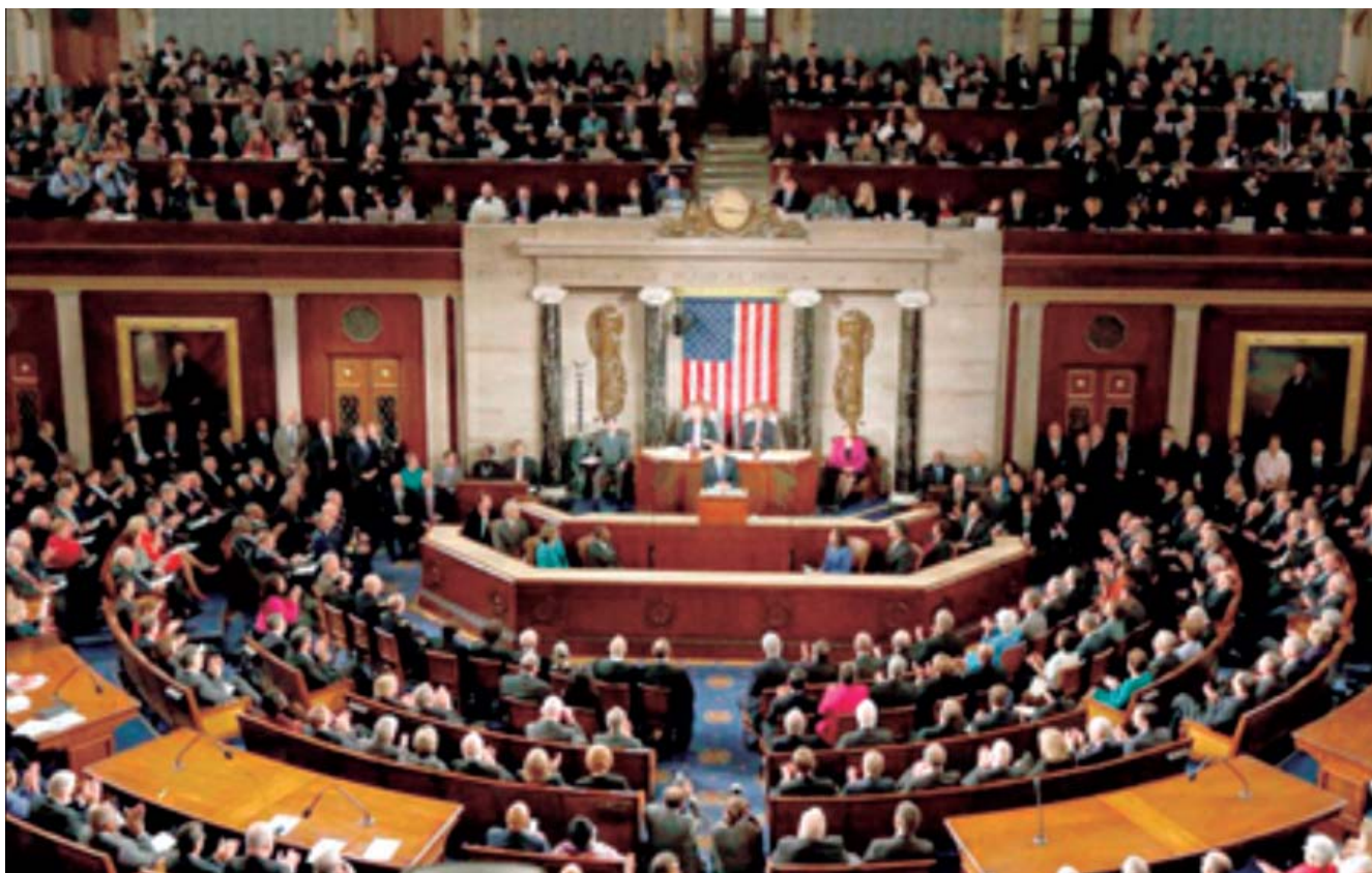
Fig. 1. Inicio de las sesiones del 114 Congreso de Estados Unidos, enero 2015.

La decisión del presidente Obama de cambiar el rumbo de la política hacia Cuba tuvo en aquel momento el respaldo de congresistas tanto demócratas