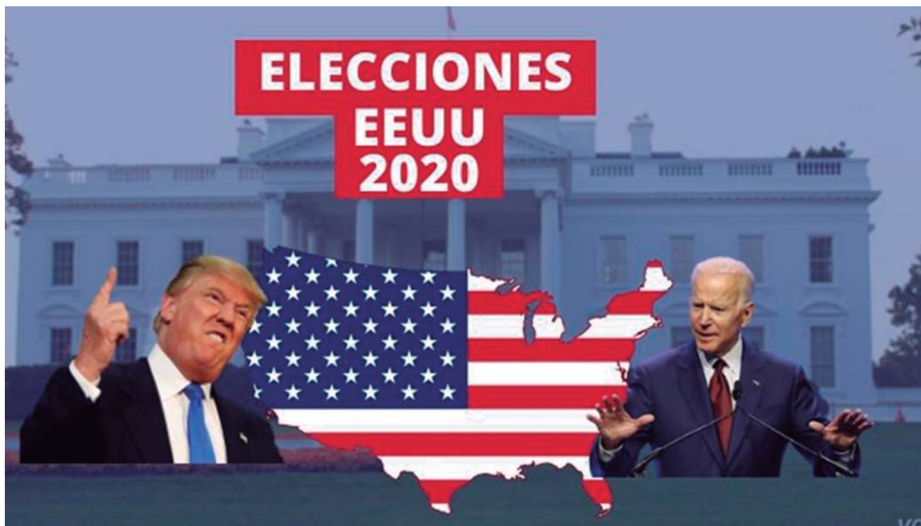
Fig. 1 Elecciones presidenciales en Estados Unidos 2020.

Uno de los contendientes, Donald Trump, representó, y a juzgar por su comportamiento como ex-presidente, aún representa, la concepción nativista, nacionalista, neoaislacionista, supremacista y socialmente conservadora que tiene el apoyo de las élites empresariales dedicadas a la industria tradicional, la energía, la construcción, la comercialización masiva de armas de fuego entre los ciudadanos y amplios sectores del complejo militar industrial. Esta vertiente tiene el apoyo de los grupos ultra-conservadores de la llamada “altright” (o derecha alternativa) y de los medios de comunicación alternativos como Breitbart News, y algunos que tratan de ubicarse en el llamado “mainstream”, como Fox News, organizaciones como la Asociación Nacional del Rifle, las iglesias evangelistas y centros de pensamiento de derecha como la Heritage Foundation o American Enterprise Institute.