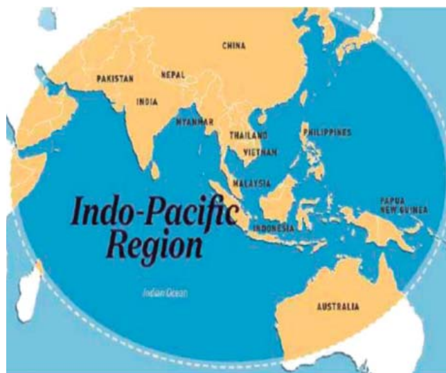
Fig. 1. Región Indo Pacífico.

Subsiguientemente, la administración Trump, aun cuando ha evitado utilizar la denominación de Rebalance, continuó concentrando su accionar en la región, a la que rebautizó como Indo Pacific (lo cual incluyó el cambio de denominación del Comando Unificado que responde por esa área, que cambió su nombre de U.S. PACIFIC COMMAND por U.S. INDO-PACIFIC COMMAND); esto se confirmó tanto en su actividad política (por ejemplo, en febrero de 2017 el entonces Secretario del DOD, James N. Mattis, en su primera visita al exterior se dirigió a Japón y Corea del Sur, no a los países de la OTAN), como en sus principales documentos estratégicos: la Estrategia de Seguridad Nacional de 2017, la Estrategia de Defensa Nacional de 2018; los diferentes reportes del Director Nacional de Inteligencia, de los Comités del Congreso, etc; la participación en importantes eventos en la región, como el Foro Regional de la ASEAN y el Diálogo Shangri-lá, y confirmado con la emisión de documentos más