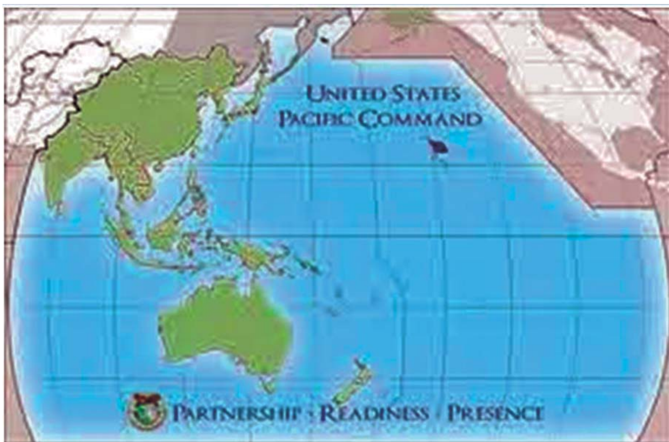
Fig. 3 Comando Indo Pacífico

En estos documentos se plantea que su Estrategia para el Indo Pacífico está en conexión con sus intereses expresados en la Estrategia de Seguridad Nacional de 2017, y que la región tiene tanto valor