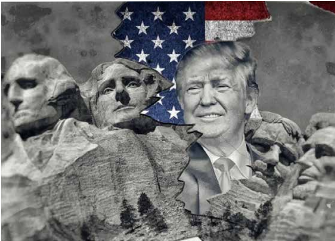
Fig. 2. Parodia que expresa la polarización política y el auge de la extrema derecha en Estados Unidos.

y sus representaciones partidistas ( Comunist Party , Socialist Workers Party ) o socioeconómicas ( Occupy Wall Street ) contestatarias, interesadas al menos en reformas sensibles, cuando no en mutaciones más profundas. Entre sus componentes cabrían las organizaciones del movimiento negro, latino, feminista, juvenil, de defensa de los derechos de los homosexuales, junto a determinados sindicatos y grupos ambientalistas y pacifistas. Un segmento del Partido Demócrata, caracterizado por posturas cercanas a lo que se ha descrito, denominado como su ala radical , se ubica también, como regla, en la izquierda estadounidense, junto a ciertas expresiones religiosas como las de los Pastores por la Paz. La derecha, por su parte, comprende las instituciones consustanciales al sistema, comprometidas con las elites de poder, incluyendo al Partido Republicano en su conjunto, aunque pueda exceptuarse algún segmento moderado o razonable, pero a la vez, a un sector del demócrata, el que se conoce como su ala derecha , junto a entidades de la sociedad civil, como la Sociedad John Birch, la Asociación Nacional del Rifle, el Ku-Klux-Klan, el Movimiento Vigilante, el Movimiento de Identidad Cristiana y no pocas denominaciones protestantes insertadas en la conocida Derecha Evangélica (Fig. 2).