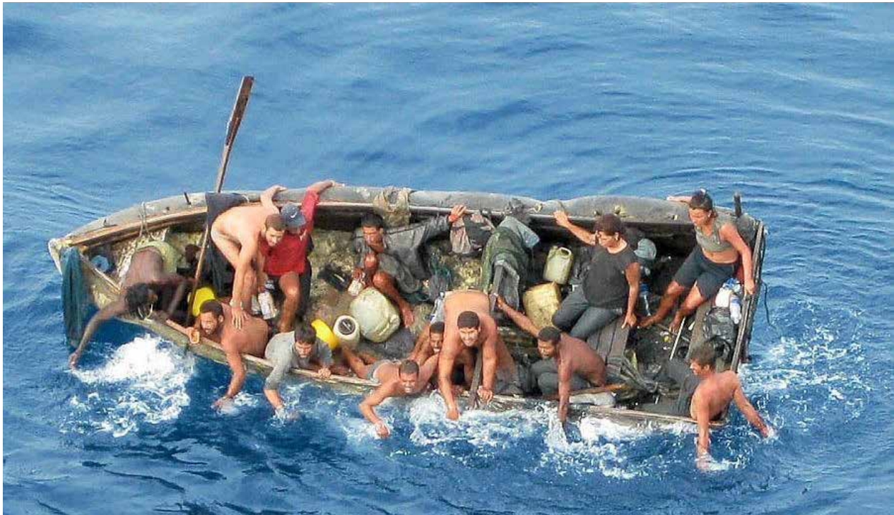
Fig. 1. Por décadas la Ley de Ajuste Cubano ha sido un factor fundamental en el estímulo a la emigración cubana, principalmente mediante vías irregulares.

Académicos en Estados Unidos han señalado las múltiples contradicciones que desde diferentes perspectivas presenta la Ley de Ajuste Cubano (Eckstein; 2016; Reynolds, 2011). Sin embargo, como la observación histórica corrobora, las contradicciones por sí solas no han sido suficientes para la dero-