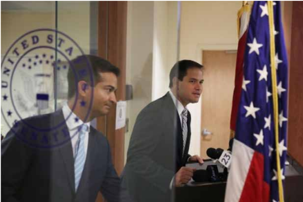
Fig. 3. El representante Carlos Curbelo (izquierda) y el senador Marco Rubio (derecha), propusieron cambios en la interpretación de la Ley de Ajuste Cubano entre 2015 y 2016, a fin de condicionar la conducta política de los emigrados cubanos.

origen, distinguida por su carácter cada vez más transnacional. 12